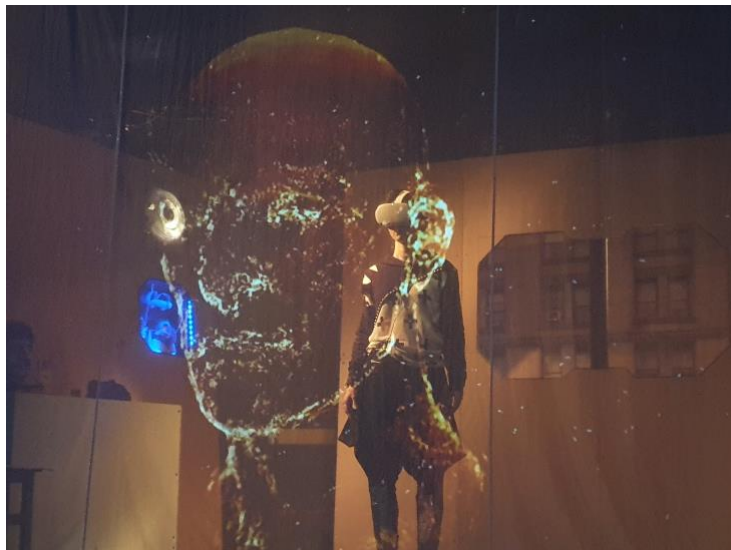
Abbildung 2: Blade Runner (c)Lisa Zingerle

19:30 Uhr: Ein Würstelstand auf Weltreise Online + Ausstrahlung vor Ort im Schubert Theater (für Online-Zugang bitte um Anmeldung unter info(at)schuberttheater.at )