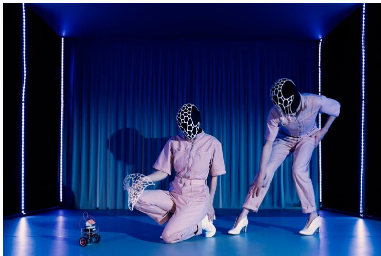
Abbildung 1: 1/0/1-ROBOTS

Das Berliner manufaktor-Kollektiv für zeitgenössisches Figurentheater präsentiert erstmals die queerfeministische Robotopien in Wien beim Future Lab des Schubert Theaters.